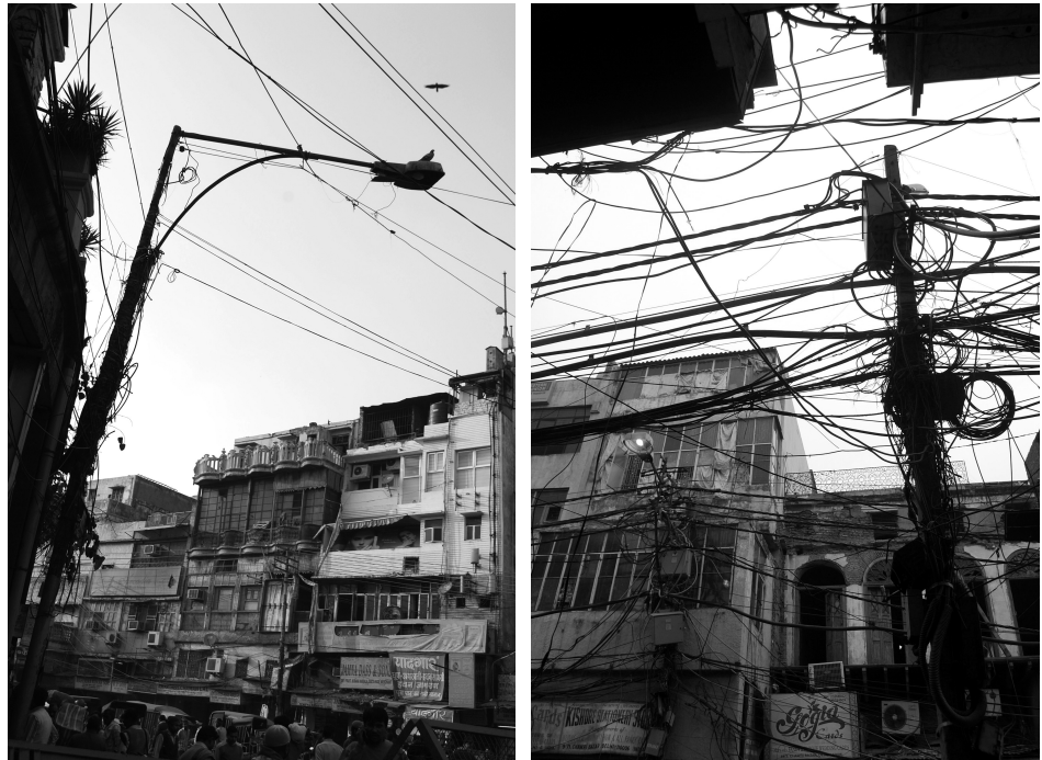
Immagine 2-3. Shajhanabad: pattern compositivo della città storica