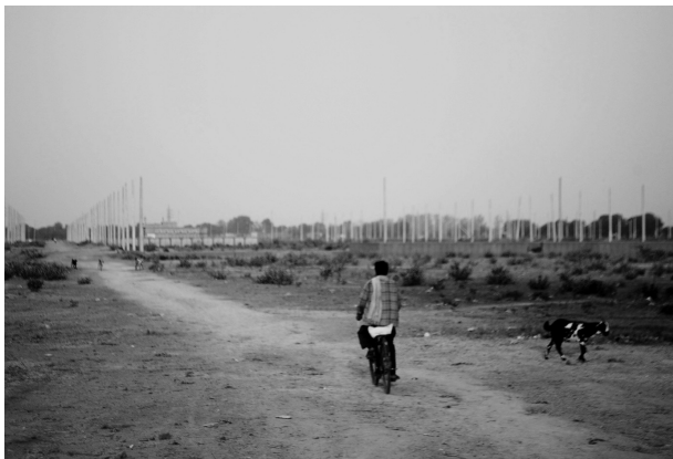
Immagine 9. Spazio liscio nella colonia di reinsediamento