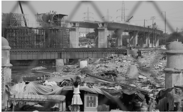
Immagine 8. Lavori in corso pre-Commonwealth Games, Ottobre 2010