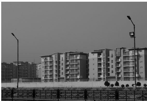
Immagine 6-7. Villaggio per gli atleti, Commonwealth Games 2010