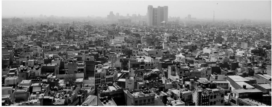
Immagine 1. Vista della città di Delhi