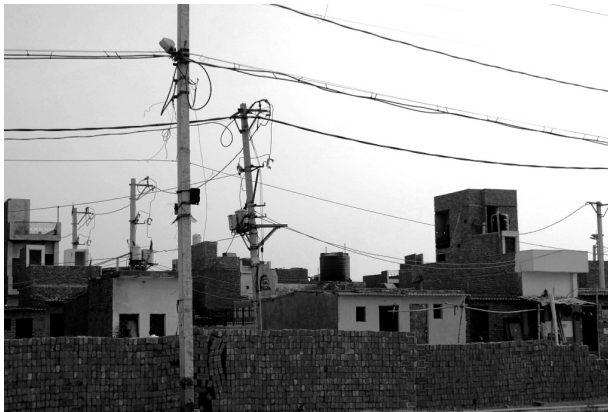
Immagine 10. Colonia di reinsediamento

Tutte le immagini sono state scattate da Claudia Roselli in un arco di tempo tra il 2009 e il 2012.